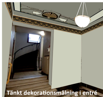
Tänkt dekorationsmålning i entré

en varierar därför mellan lägenheterna. Flera lägenheter byggs om i sin helhet medan andra bara får nya badrum och avloppsstammar. I samband med lägenhetsrenoveringarna görs en allmän uppfräschning och upprustning av allmänna utrymmen. Tvättstuga och torkrum får nya yttskikt, förråden byts ut till nya gallerförråd och trapphuset målas om. Hagwalls Bygg är ansvarig totalentreprenör. Vi räknar med att färdigställa arbetet innan årsskiftet 2024/2025.