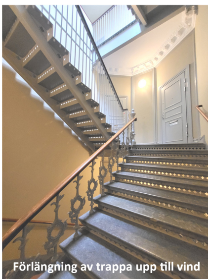
Förlängning av trappa upp till vind

ROT-renoveringen av fastigheten är nu färdig och slutbesiktigad. Renoveringen omfattade stambyte och yttskiktsrenovering i befintliga lägenheter samt nybyggnation av fyra vindslägenheter. Alla befintliga hyresgäster har återflyttat till sina lägenheter. Vi är också glada över att ha kunnat välkomna våra nya hyresgäster på vinden sedan den första juni 2024.